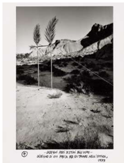
エットレ・ソットサス《メタファー：暗闇に入るためのドアのデザイン》1973年（撮影）、石橋財団アーティゾン美術館 © erede Ettore Sottsass, JASPAR, Tokyo, 2025 C5248★