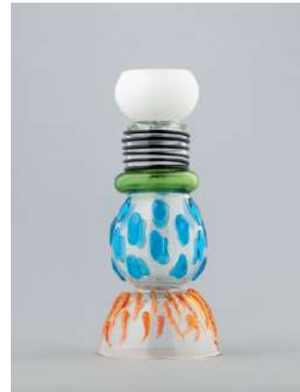
上段左. エットレ・ソットサス《カサブランカ》1981年(デザイン/製作)、製作:メンフィス・ミラノ、石橋財団アーティゾン美術館 © erede Ettore Sottsass, JASPAR, Tokyo, 2025 C5248 ★