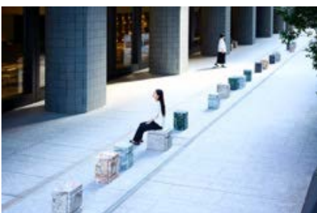
レイチェル・ホワイトリード 《Artizon Conversations》2025年、大理石、インスタレーション ©Rachel Whiteread

1963年、ロンドン生まれ。1993年、女性として初めてターナー賞を受賞し、物体と空間の関係性に新たな視点をもたらした作家として国際的に評価されている。ネガティブ・スペースをキャストする独自の手法により、記憶や痕跡、存在の不在を可視化する彫刻作品を一貫して制作している。2017年から2019年にかけて、テート・ブリテン（ロンドン）を皮切りに、ベルヴェデーレ21（ウィーン）、ワシントン・ナショナル・ギャラリー、セントルイス美術館（いずれもアメリカ合衆国）を巡回する回顧展が開催された。2023年には、ベルガモ近現代美術館（イタリア）で《...And the Animals Were Sold》を発表し、その一部である《Bergamo II》は、2024年12月よりジル サンダー 銀座に恒久設置されている。