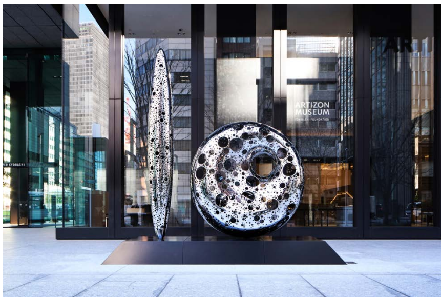
リンディ・リー 《無数の星座がうまれる》2026年、鑄造・ステンレススティール

公益財団法人石橋財団アーティゾン美術館（東京都中央区、館長：石橋寛）は、屋外彫刻の設置について、ビルの建て替えと新しい美術館構想の中で、2010年頃からプロジェクトとして進めてまいりました。また、当館の所在するミュージアムタワー京橋とTODA BUILDINGが構成する街区「京橋彩区」*の「まちに開かれた芸術・文化拠点」づくりという基本理念も視野に、この街にふさわしい屋外彫刻のあり方について検討を重ねた結果、レイチェル・ホワイトリード、リンディ・リーの二人の作家に、それぞれ新作を依頼する運びとなりました。2025年7月のレイチェル・ホワイトリードの作品設置に続き、プロジェクトの結実のふたつめとして、1月30日にリンディ・リーによる彫刻作品《無数の星座がうまれる》が、同作家による日本初の常設作品として完成しました。