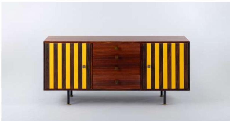
下段. エットレ・ソットサス《サイドボード (Model MS. 180)》1959年 (デザイン) / 1959年 (製作: ポルトロノーヴァ) 石橋財団アーティゾン美術館 © Erede Ettore Sottsass