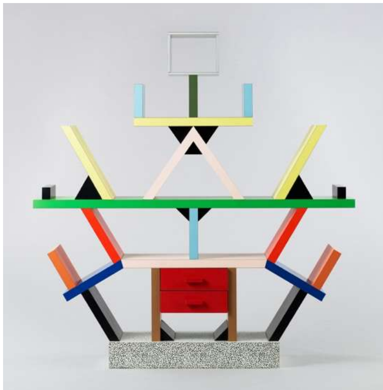
エttore・ソットサス《カールトン》1981年（デザイン）/1981年（製作：メンフィス・ミラノ）、 石橋財団アーティゾン美術館 © Erede Ettore Sottsass

公益財団法人石橋財団アーティゾン美術館（東京都中央区、館長 石橋 寛）は、「エttore・ソットサス —魔法がはじまるとき、デザインは生まれる」展を開催します。