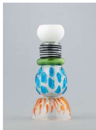
上段左. エットレ・ソットサス《カサブランカ》1981年(デザイン) / 1981年(製作: メンフィス・ミラノ)、石橋財団アーティゾン美術館 © erede Ettore Sottsass, JASPAR, Tokyo, 2025 C5248 ★