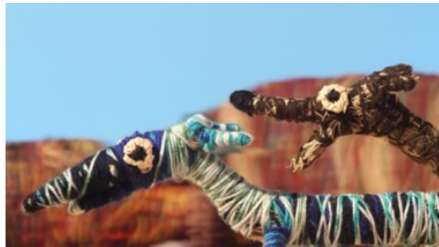
左：ジャンピ・デザート・ウィーヴァーズ《タンギ（ロバ）》2021年、映像、ジャンピ・デザート・ウィーヴァーズ、NPY ウィメンズ・カウンシル © Tjanpi Desert Weavers, NPY Women's Council 右：ジャンピ・デザート・ウィーヴァーズ《私の犬、ブルーイーとビッグ・ボーイ》2018年、映像、ジャンピ・デザート・ウィーヴァーズ、NPY ウィメンズ・カウンシル Image by Jonathan Daw. © Tjanpi Desert Weavers, NPY Women's Council