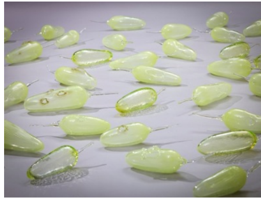
イワニ・スケース《えぐられた大地》2017年、ウランガラス（宙吹き）、 石橋財団アーティゾン美術館