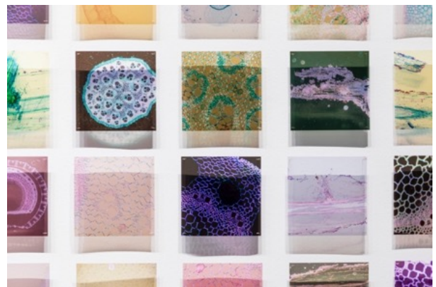
左：マリィ・クラーク《ポッサムスキン・クローク》2020-21年、ポッサムの毛皮、ヴィクトリア州立美術館 © Maree Clarke 右：マリィ・クラーク《私を見つけましたね：目に見えないものが見える時》(部分) 2023年、顕微鏡写真・アセテート、作家蔵 (ヴィヴィアン・アンダーソン・ギャラリー) Installation view of Between Waves , Australian Centre for Contemporary Art, Melbourne. © Maree Clarke