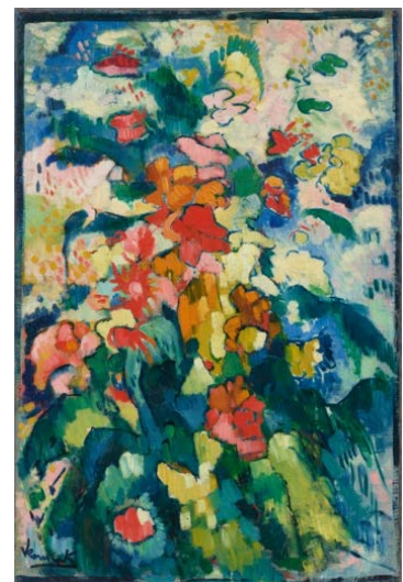
モーリス・ド・ヴラマンク《色彩のシンフォニー (花)》1905-06年頃 石橋財団アーティゾン美術館【新収蔵作品】