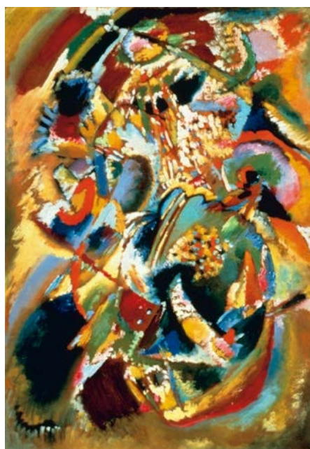
ヴァシリー・カンディンスキー《「E.R.キャンベルのための壁画No.4」の習作（カーニバル・冬）》1914年 宮城県美術館

公益財団法人石橋財団アーティゾン美術館（館長 石橋 寛）は、「ABSTRACTION 抽象絵画の覚醒と展開 セザンヌ、フォーヴィスム、キュビズムから現代へ」を開催いたします。