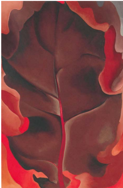
ジョージア・オキーフ《オータム・リーフ II》1927年 石橋財団アーティゾン美術館 【新収蔵作品】★ © 2023 The Georgia O' Keeffe Foundation/ ARS, New York/ JASPAR, Tokyo C4125