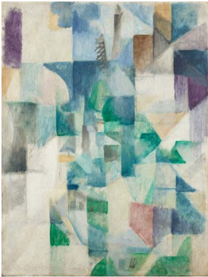
ロベール・ドローネー《街の窓》1912年 石橋財団アーティゾン美術館【新収蔵作品】