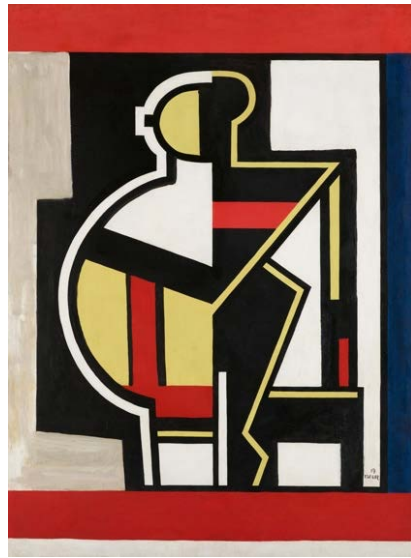
フェルナン・レジェ《抽象的コンポジション》 1919年 石橋財団アーティゾン美術館