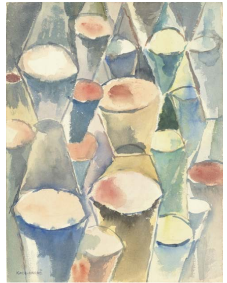
古賀春江《円筒形の画像》1926年頃 石橋財団アーティゾン美術館