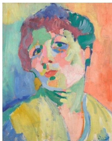
アンドレ・ドラン《女の頭部》1905年頃 石橋財団アーティゾン美術館【新収蔵作品】