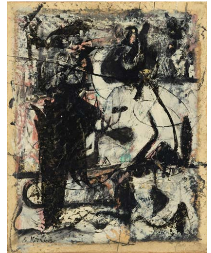
ウィレム・デ・クーニング《一月》1947- 48年 石橋財団アーティゾン美術館【新収 蔵作品】★ © 2023 The Willem de Kooning Foundation, New York/ ARS, New York/ JASPAR, Tokyo C4125