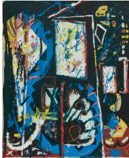
ジャクソン・ポロック《無題（縦にされた台形 のあるコンポジション）》1943年頃 個人蔵