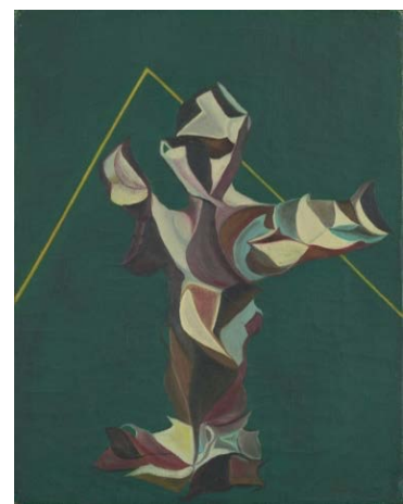
福島秀子《MP》1950年 個人蔵 (石橋財団アーティゾン美術館寄託) @Kazuo Fukushima