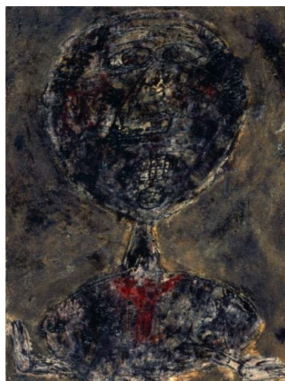
ジャン・デュビュッフェ《ピエール・マティスの 暗い肖像》1947年 ポンピドゥー・センター、 パリ 国立近代美術館／産業創造センター ★ © ADAGP, Paris & JASPAR, Tokyo 2023 C4125