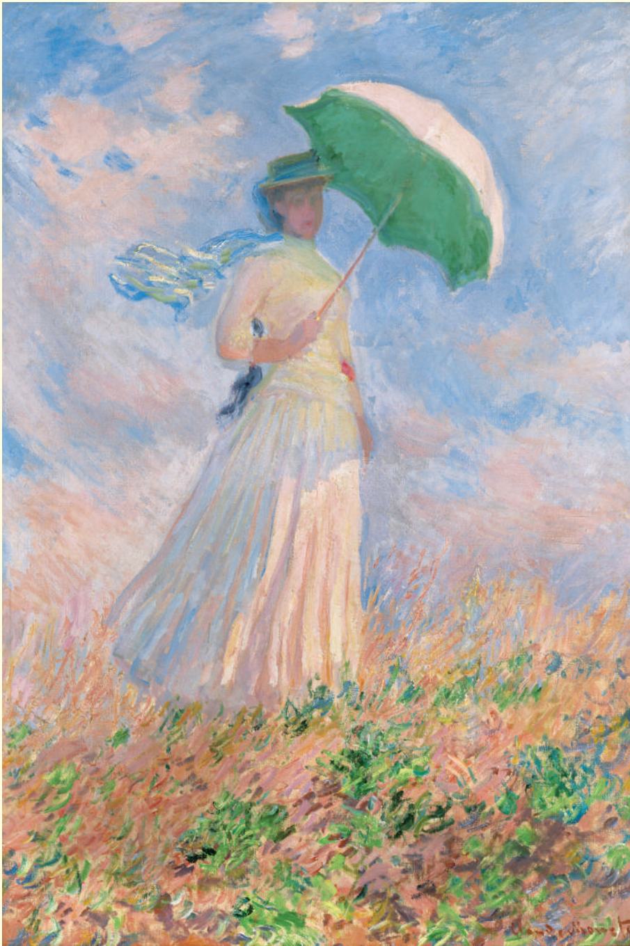
クロード・モネ《戸外の人物習作―日傘を持つ右向きの女》1886年 油彩・カンヴァス オルセー美術館蔵 Claude MONET Study of a Figure Outdoors (Facing Right) 1886 Oil on canvas Musée d'Orsay