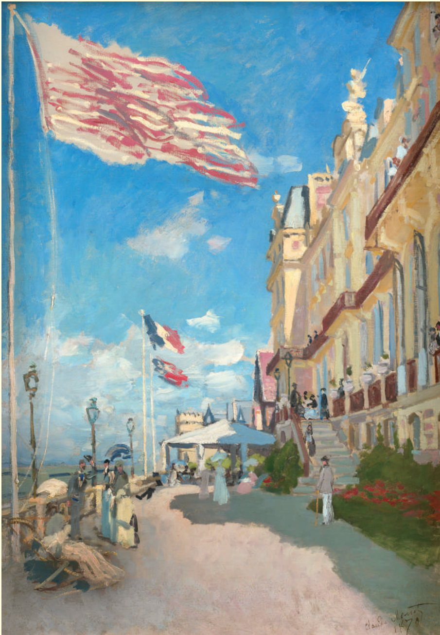
クロード・モネ《トルーヴィル、ロシュ・ノワールのホテル》1870年 油彩・カンヴァス オルセー美術館蔵 Claude MONET Hôtel des Roches Noires, Trouville 1870 Oil on canvas Musée d'Orsay