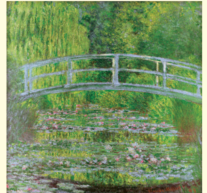
クロード・モネ《睡蓮の池、緑のハーモニー》1899年 油彩・カンヴァス オルセー美術館蔵 Claude MONET Water-Lily Pond, Symphony in Green 1899 Oil on canvas, Musée d'Orsay