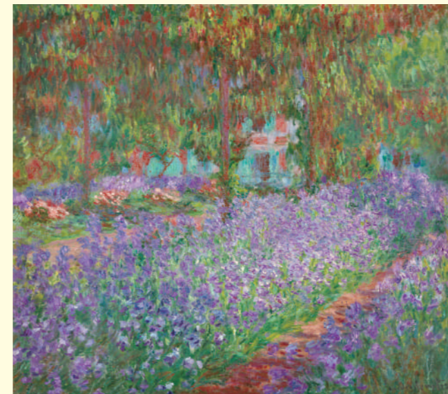
クロード・モネ《ジヴェルニーのモネの庭》1900年 油彩・カンヴァス オルセー美術館蔵 Claude MONET Iris in Monet's Garden 1900 Oil on canvas, Musée d'Orsay