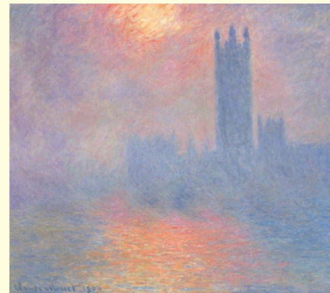
クロード・モネ《ロンドン国会議事堂、霧の中に差す陽光》1904年 油彩・カンヴァス オルセー美術館蔵 Claude MONET London, Houses of Parliament, Effect of Sunlight in the Fog 1904 Oil on canvas, Musée d'Orsay

This exhibition will display 90 works from the Musée d'Orsay, including more than 40 of the paintings by Monet that are the museum's pride and joy, plus works from the Artizon Museum, other museums in Japan, and private collections. Through these approximately 140 works we explore Monet's fascination as a landscape painter.