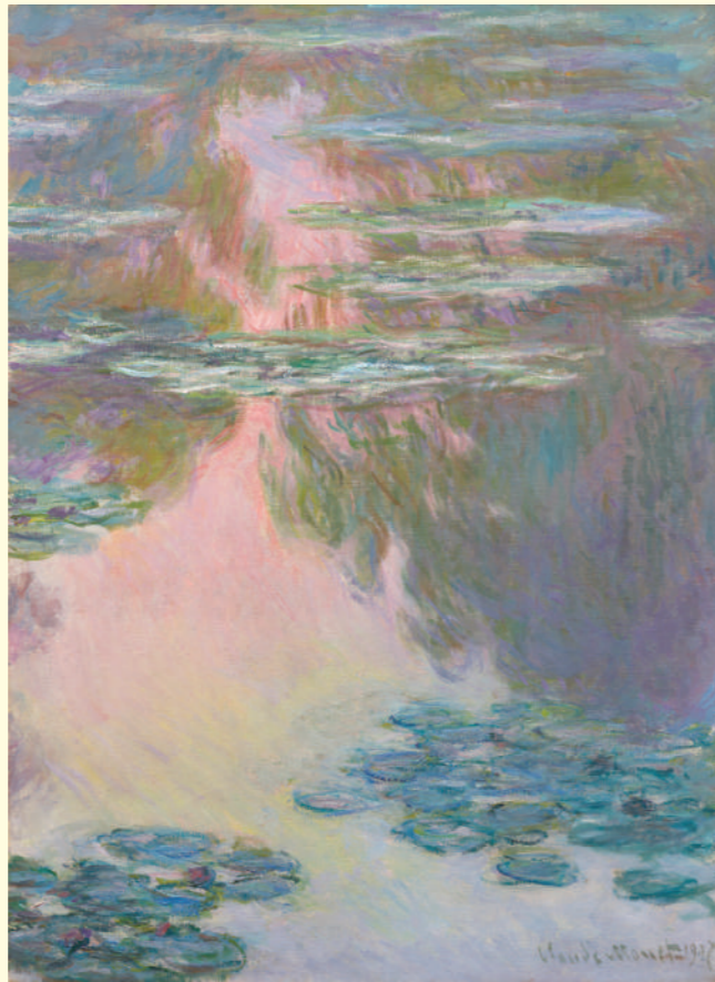
クロード・モネ《睡蓮の池》1907年 油彩・カンヴァス 石橋財団アーティゾン美術館蔵 Claude MONET Water Lily Pond 1907 Oil on canvas, Artizon Museum, Ishibashi Foundation

オルセー美術館が誇るモネの作品40点以上を含む約90点に、アーティゾン美術館をはじめとする国内の美術館や個人所蔵の作品を加えた、約140点を通して、風景画家としてのモネの魅力に迫ります。