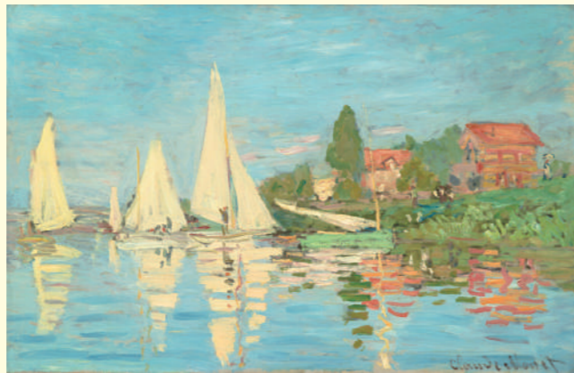
クロード・モネ《アルジャントゥイユのレガッタ》1872年頃 油彩・カンヴァス オルセー美術館蔵 Claude MONET Regatta at Argenteuil ca.1872 Oil on canvas, Musée d'Orsay