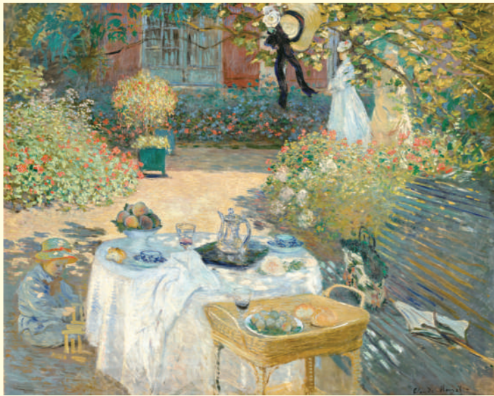
クロード・モネ《昼食》1873年頃 油彩・カンヴァス オルセー美術館蔵 Claude MONET The Luncheon ca.1873 Oil on canvas, Musée d'Orsay