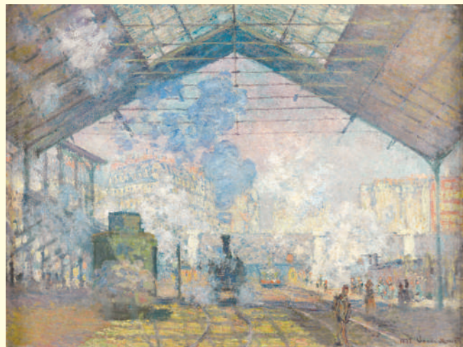
クロード・モネ《サン＝ラザール駅》1877年 油彩・カンヴァス オルセー美術館蔵 Claude MONET The Saint-Lazare Station 1877 Oil on canvas, Musée d'Orsay