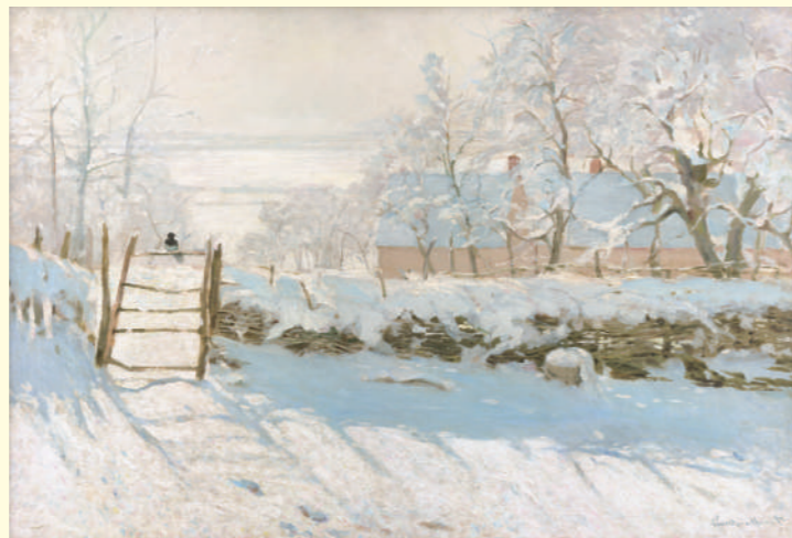
クロード・モネ《かささぎ》1868-69年 油彩・カンヴァス オルセー美術館蔵 Claude MONET The Magpie 1868-69 Oil on canvas, Musée d'Orsay

The Impressionist painter Claude Monet (1840–1926) was fascinated by the beauty of natural light. While exploring ways to express that beauty, he created innovative landscape paintings that intertwine the worldview and lyricism of a new era.